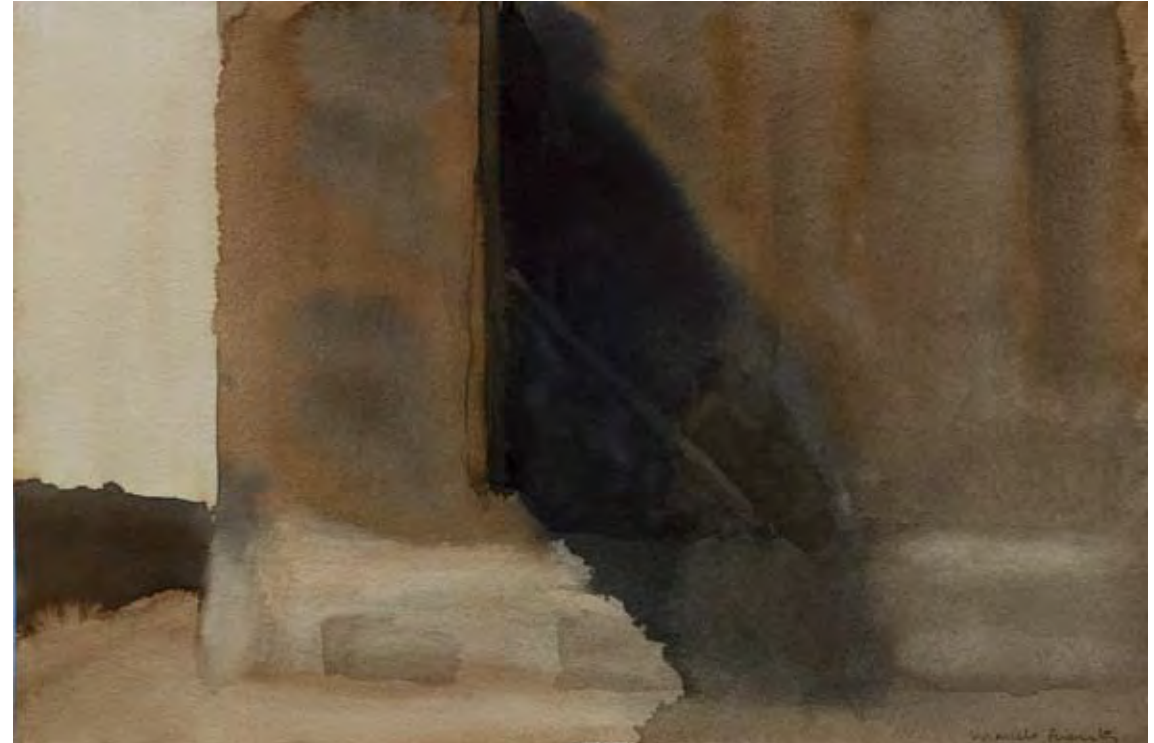
Acuarela, 17,5 x 28 cm.