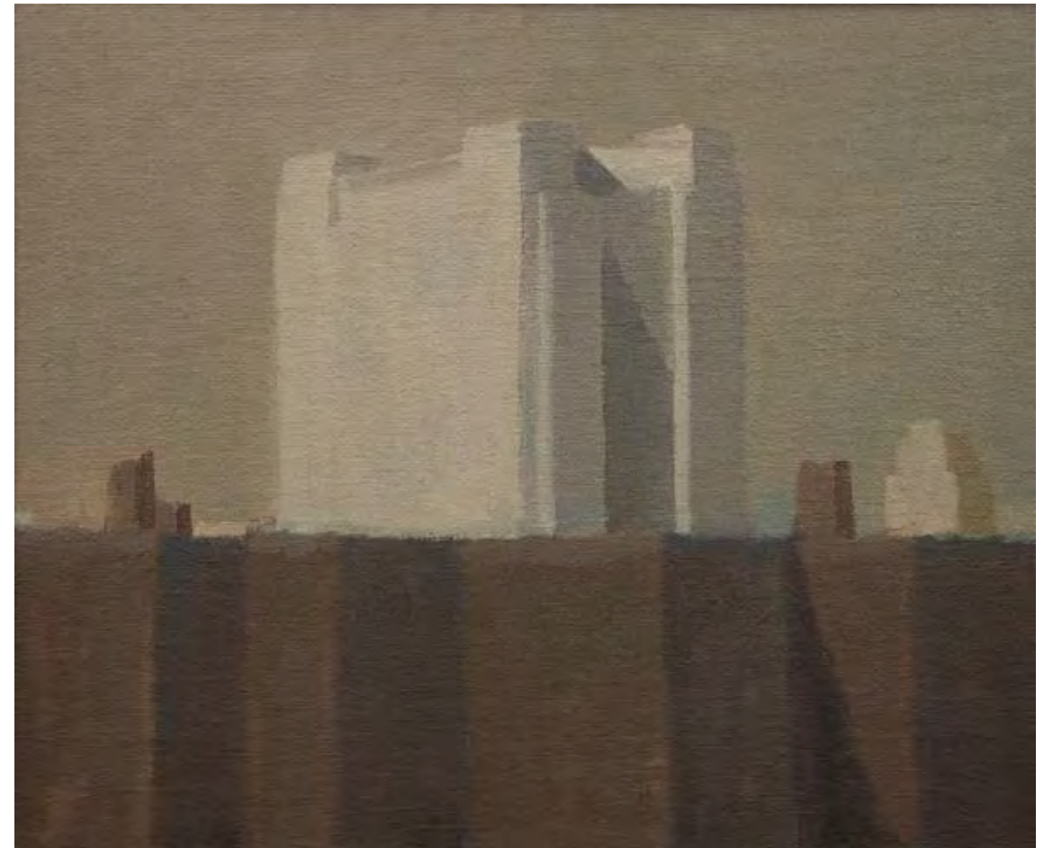
Óleo sobre lienzo, 24,3 x 29 cm.