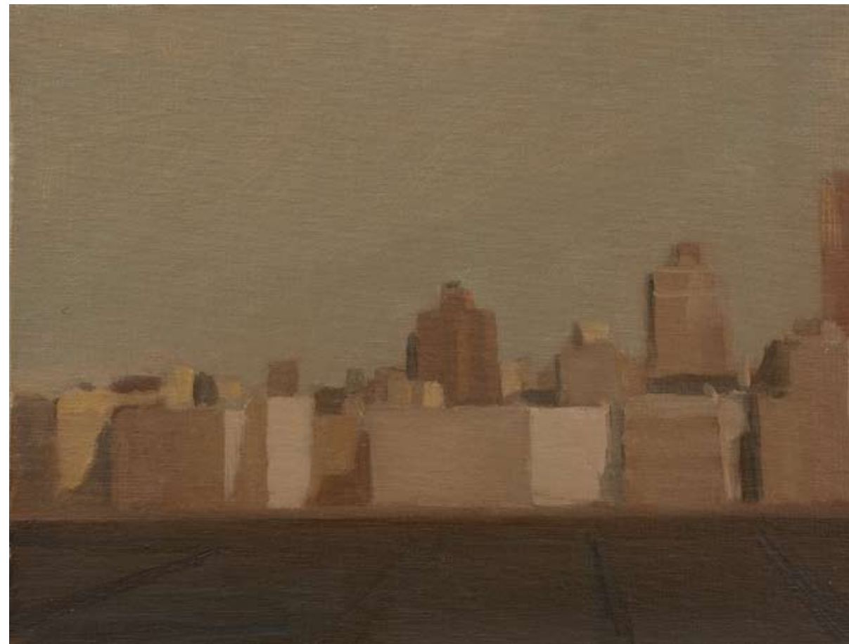
Óleo sobre lienzo, 29 x 38 cm.