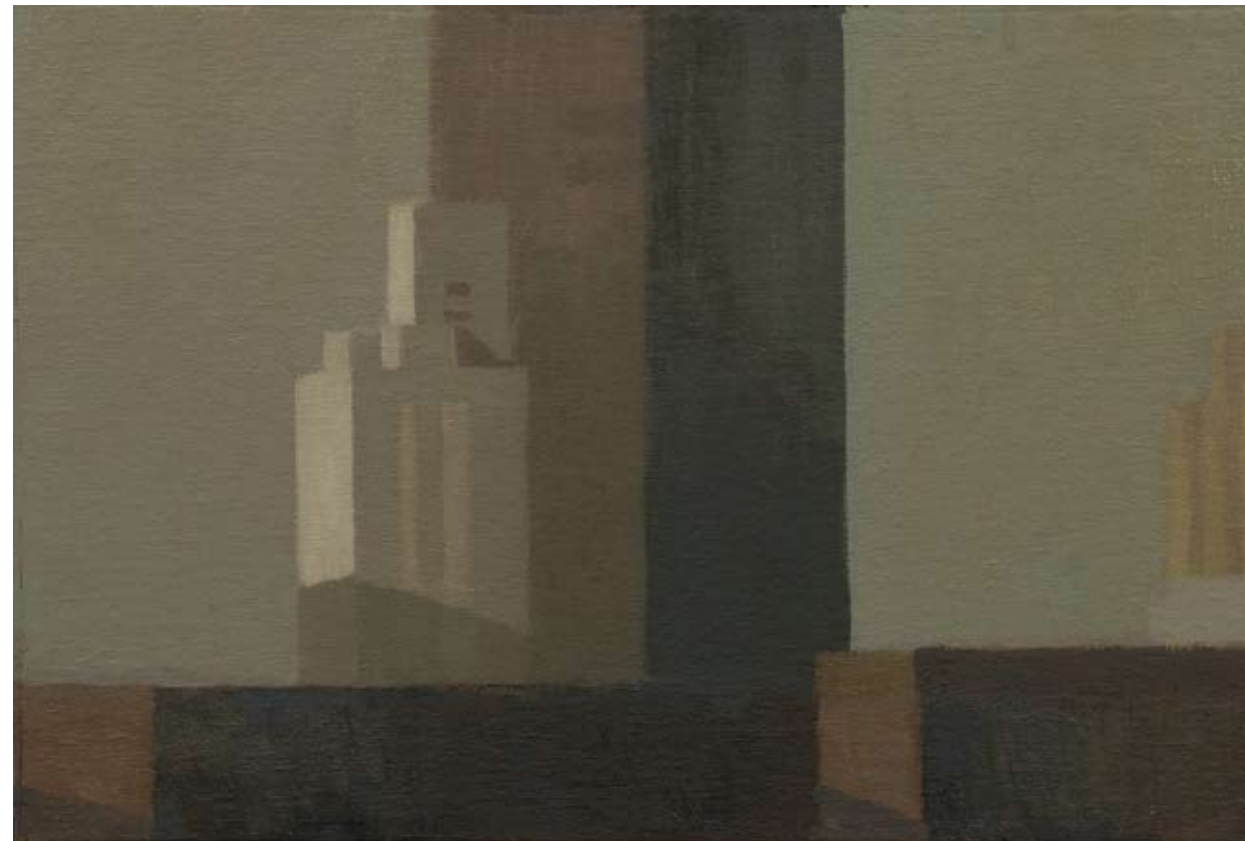
Óleo sobre lienzo, 28 x 42 cm.