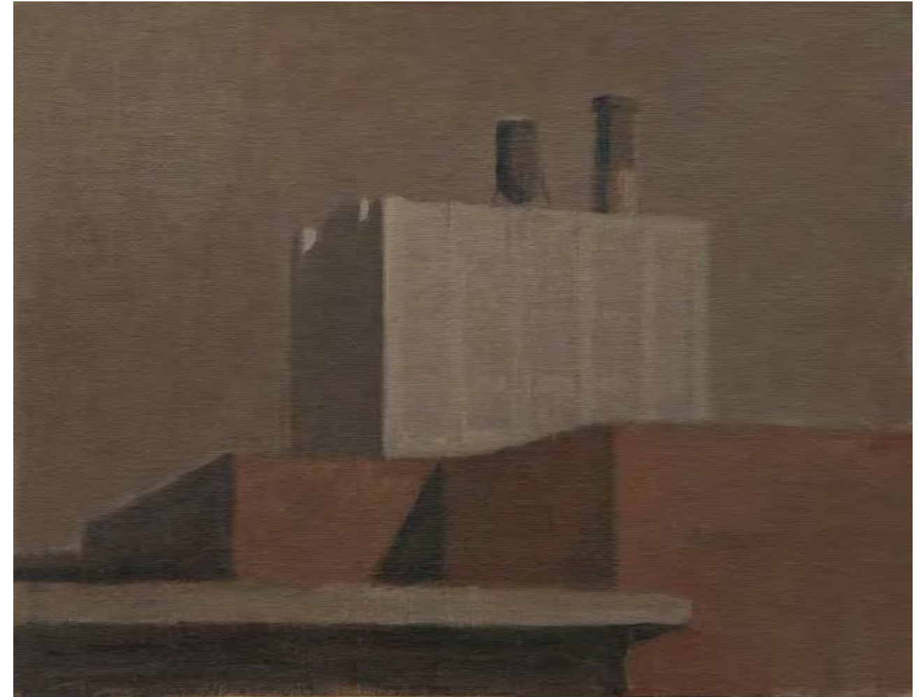
Óleo sobre lienzo, 50 x 61 cm.