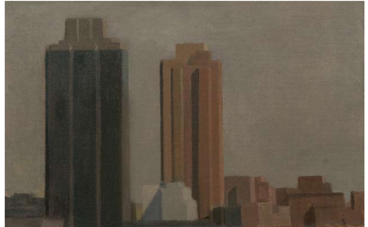
Óleo sobre lienzo, 24,5 x 41 cm.