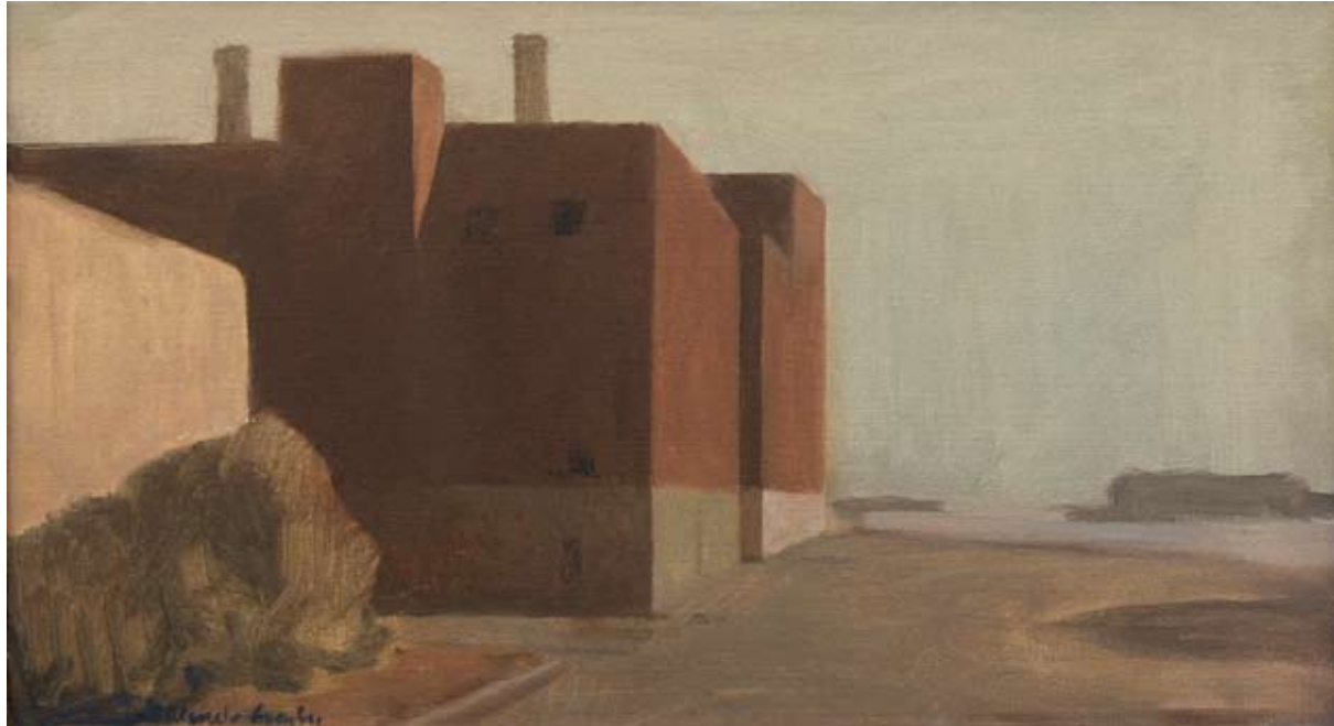
Óleo sobre lienzo, 26 x 46,5 cm.