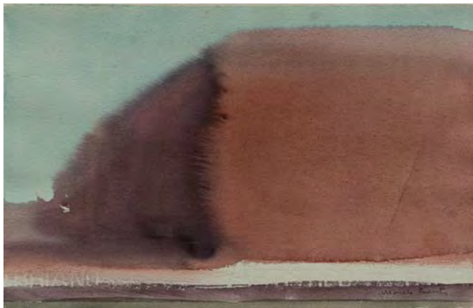
Acuarela, 17,5 x 28 cm.