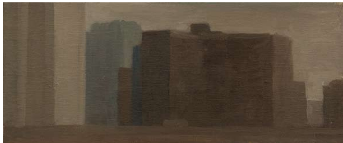
Óleo sobre lienzo, 15,5 x 36 cm.