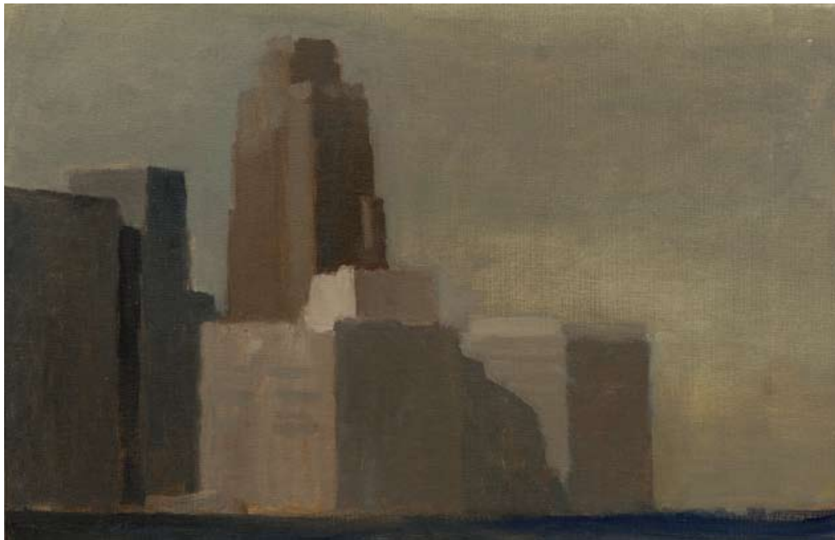
Óleo sobre lienzo, 29 x 45 cm.