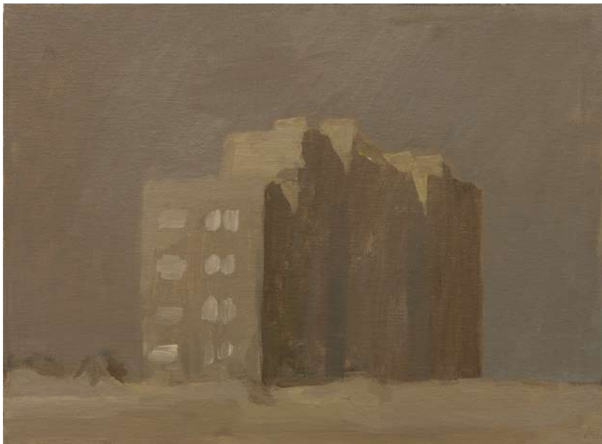
Oleo sobre lienzo, 31 x 43,5 cm.