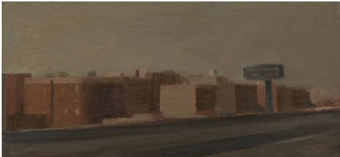
Óleo sobre lienzo, 20 x 42,5 cm.