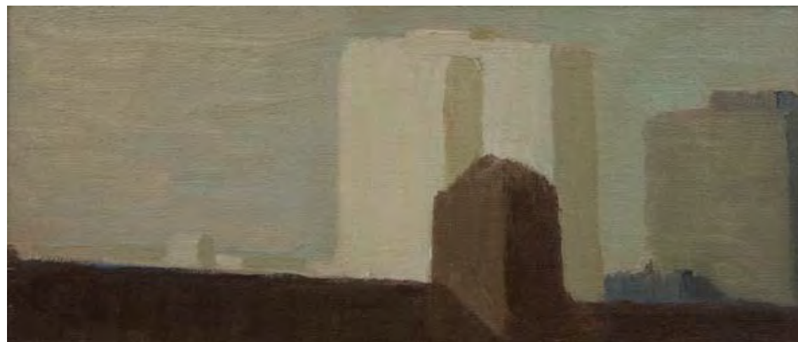
Óleo sobre lienzo, 15,5 x 35 cm.