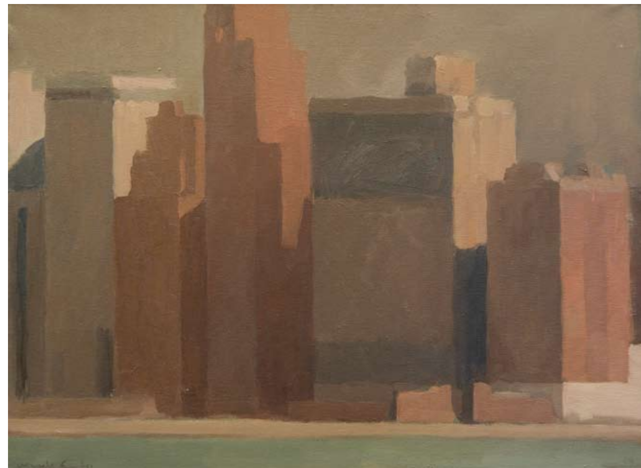
Óleo sobre lienzo, 43 x 60 cm.