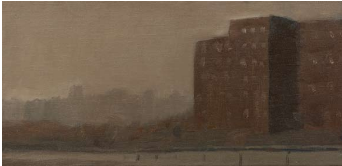
Óleo sobre lienzo, 20,5 x 44 cm.