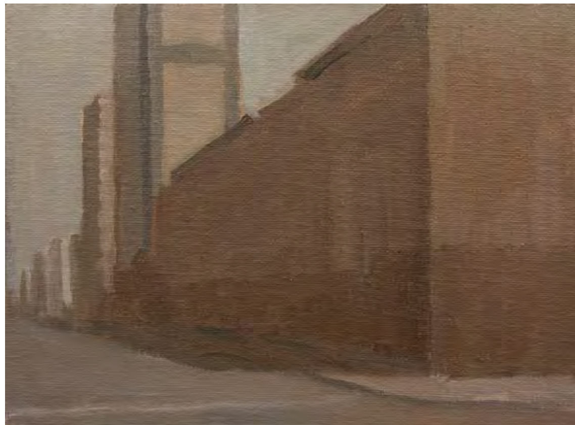
Óleo sobre lienzo, 18,5 x 25 cm.