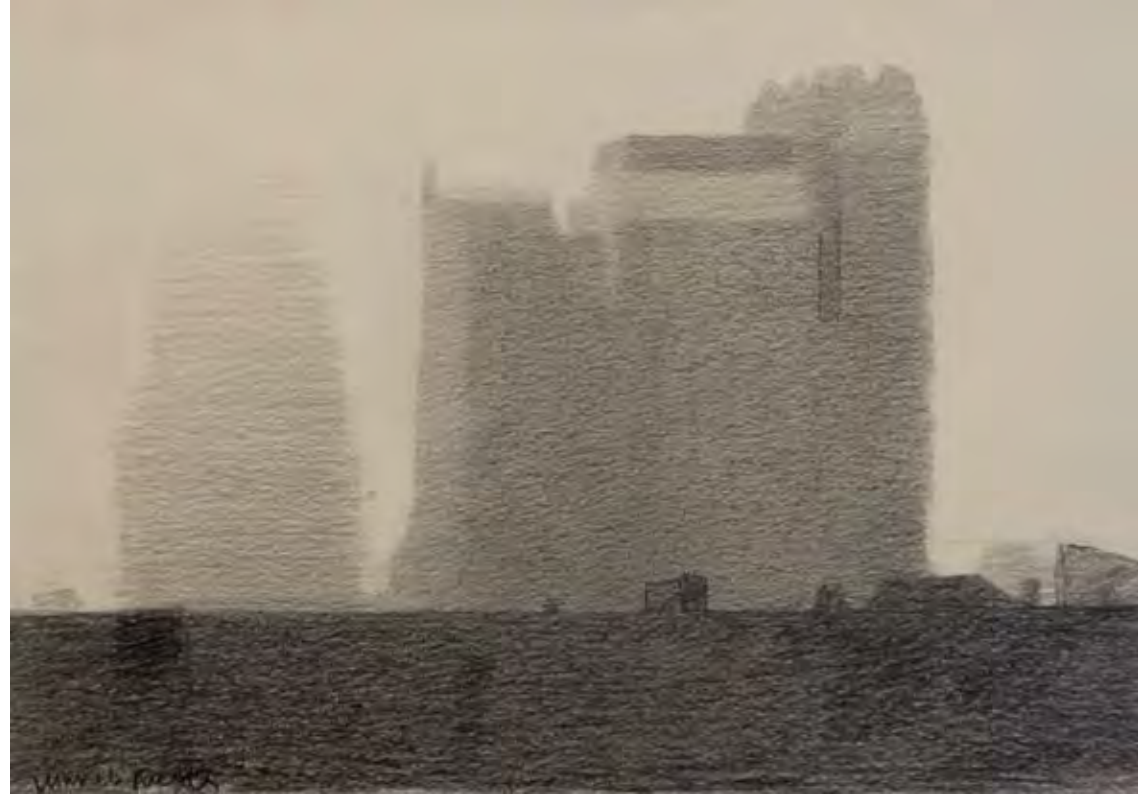
Lápiz-papel, 17 x 24 cm.