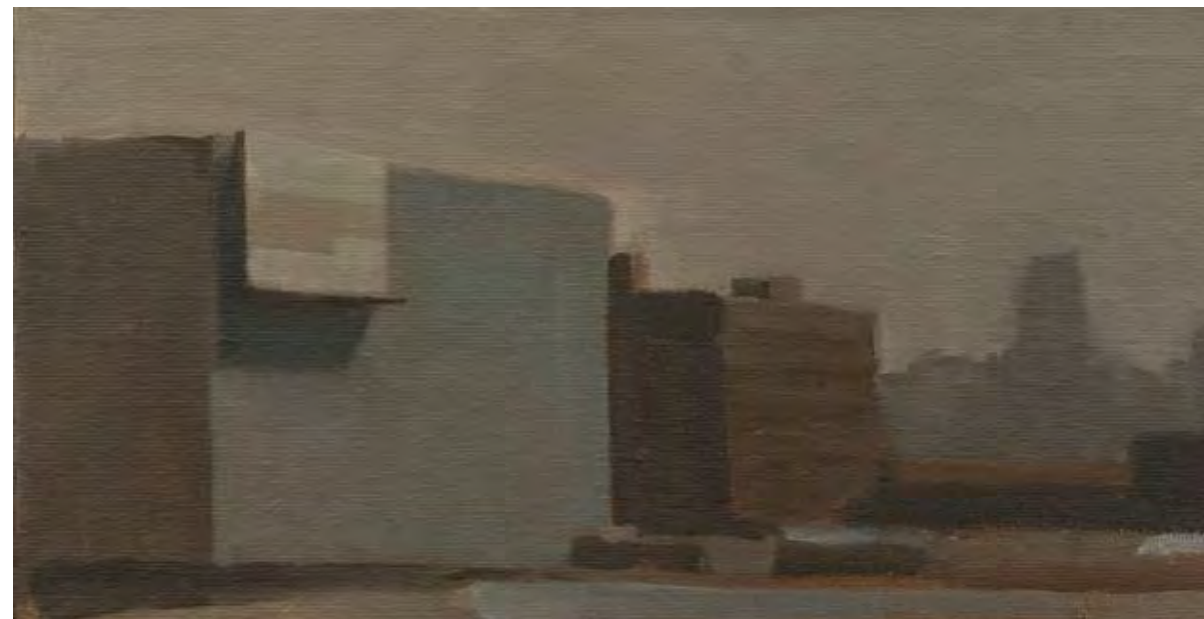
Oleo sobre lienzo, 50 x 61 cm.