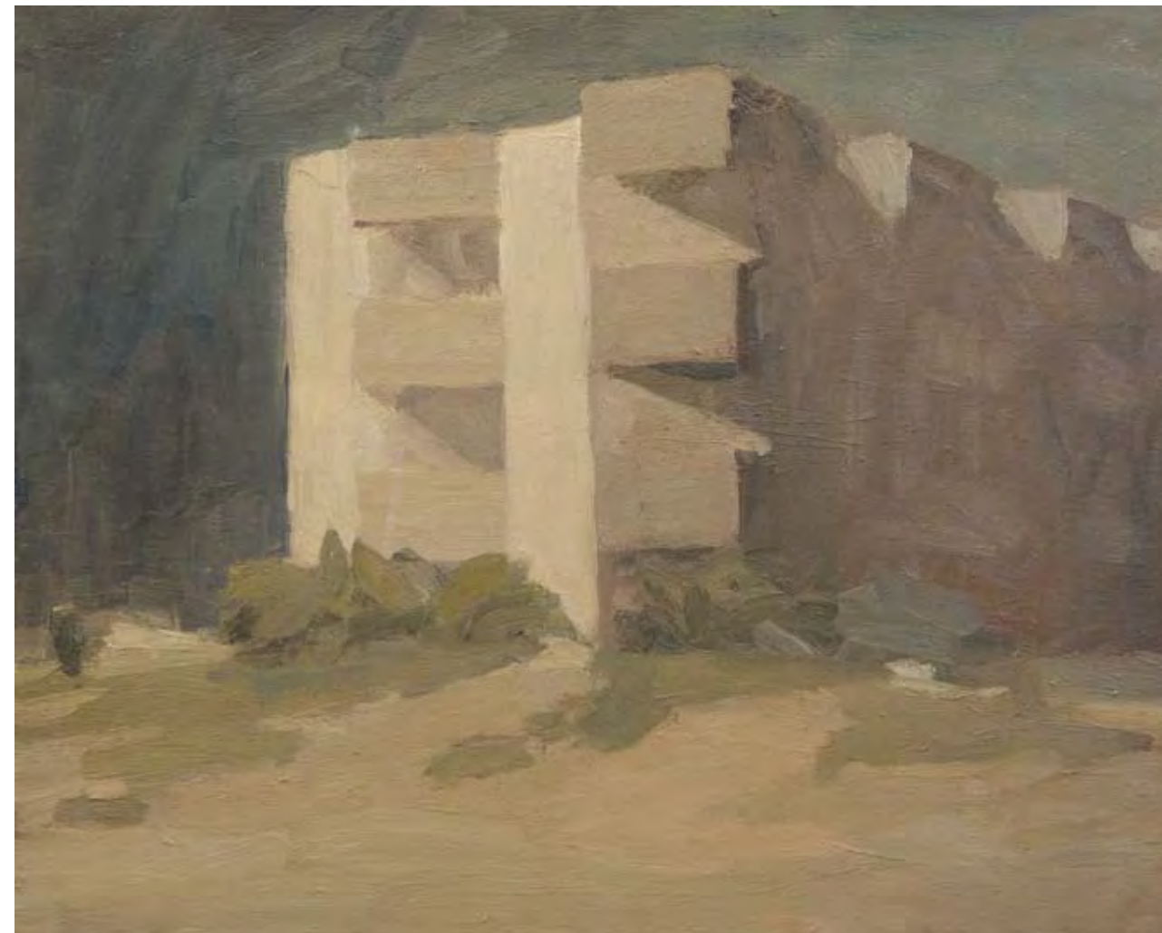
Oleo sobre lienzo, 50 x 61 cm.