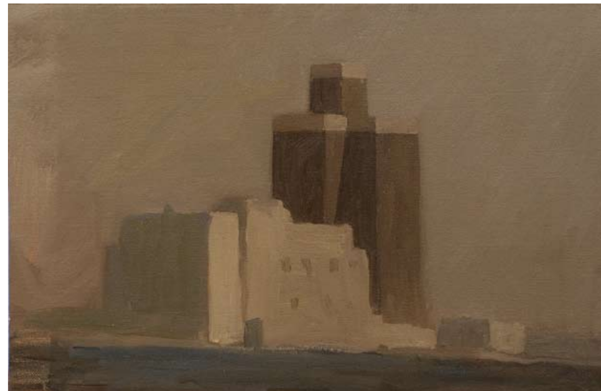
Oleo sobre lienzo, 27 x 41 cm.