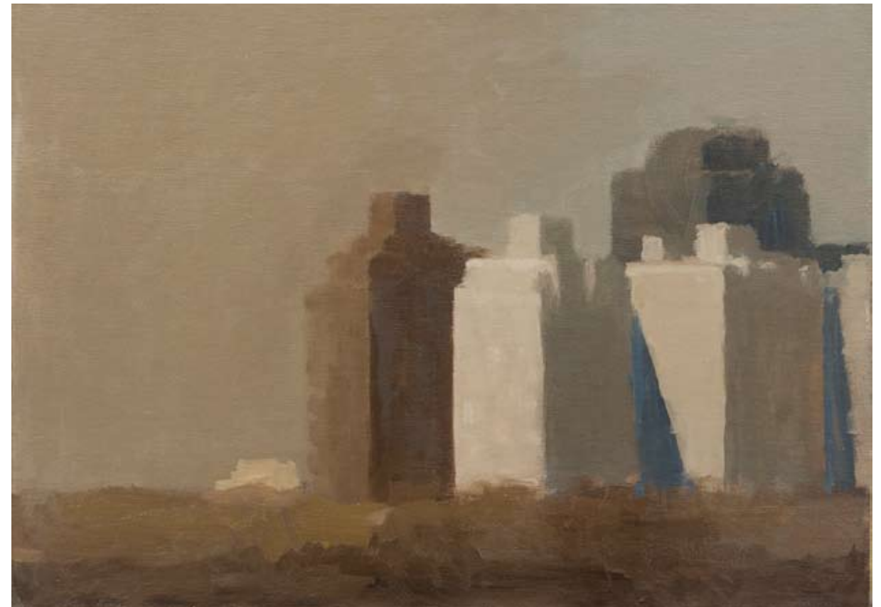
Óleo sobre lienzo, 30 x 43,5 cm.